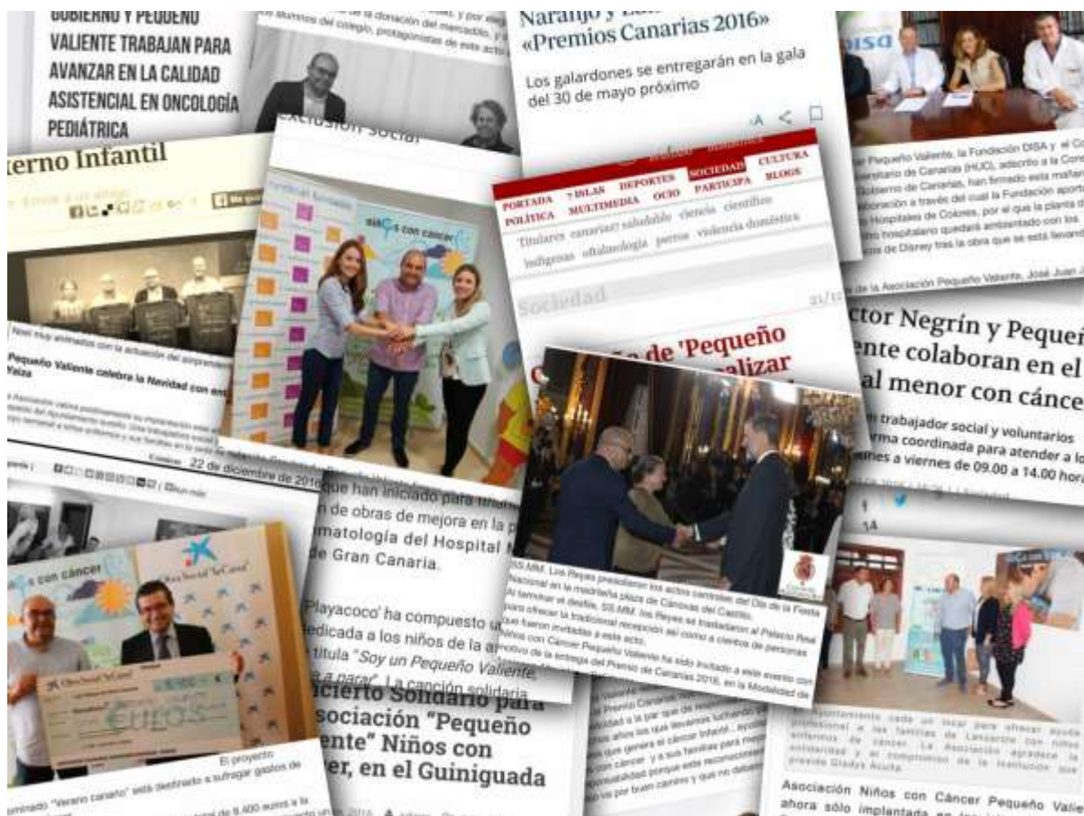
Más de 10.000 publicaciones en prensa, radio o Internet